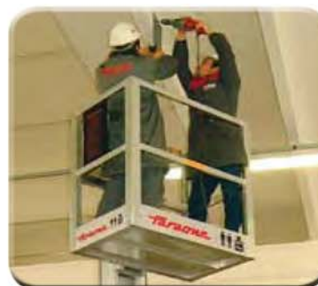
Cestello per 2 operatori